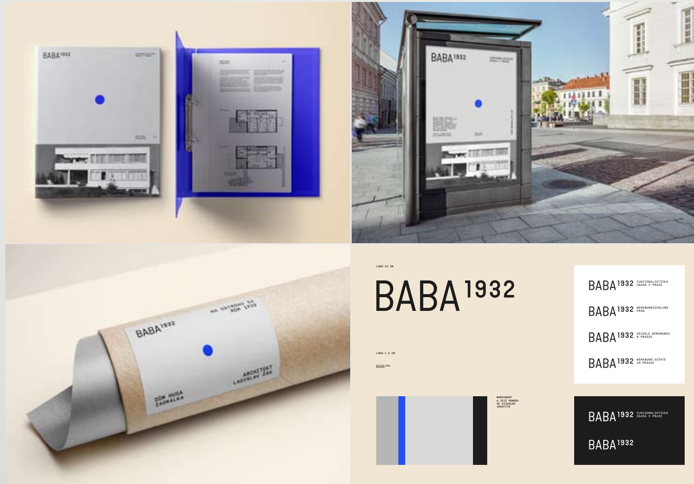
📍 Markéta Steinert: soutěžní návrh č. 1 📍 Markéta Steinert: soutěžní návrh č. 2