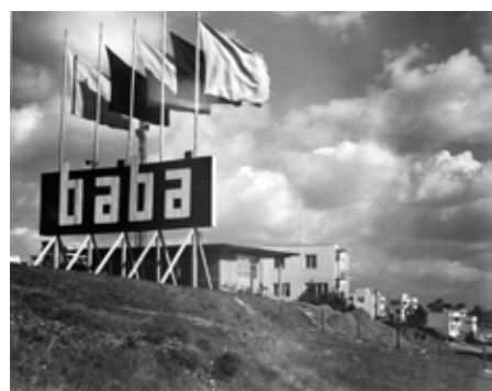
📍 Poutač u vstupu na výstavu z roku 1932, autorem grafického řešení výstavy bydlení byl Ladislav Sutnar.